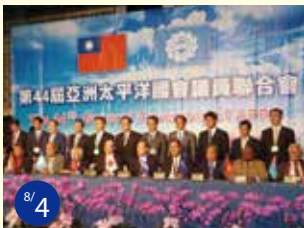
8/4 台湾訪問 アジア・太平洋国会議員連合会の日本代表として訪問、地球温暖化対策について討議