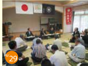
6/29 「ふるさと対話集会」in布野・三次 山林荒廃・後継者・鳥獣害・過疎対策、年金・医療問題、化石燃料と地球温暖化、環境汚染問題等々、活発な意見交換。