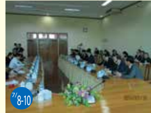
7/8-10 ミャンマー訪問 日本・ミャンマー友好議員連盟会員として、今後の友好発展のため各大臣を表敬訪問