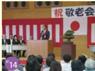
9/14 敬老会 広島6区各々で開催された敬老会に参加