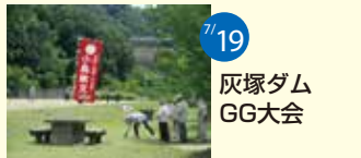
7/19 灰塚ダム GG大会