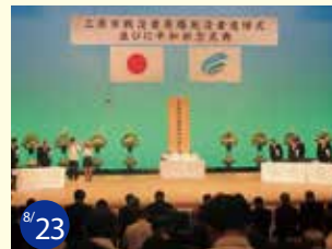
8/23 三原市戦没者原爆死没者追悼式並びに平和祈念式典