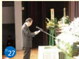
7/27 世羅町戦没者追悼式