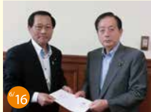
6/16 自転車活用議員連盟の要望 太田国土交通大臣にしまなみ海道を「ナショナルサイクリングロード誕生の要望」