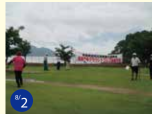
8/2 支部長杯因島GG親善大会