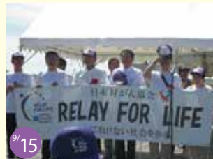
9/15 がんにはげない社会を作る 尾道市で開催された「リレー・フォー・ライフ フジヤパン 2014広島」の開会式に参加