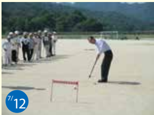
7/12 三原ゲートボール大会