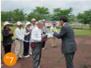
6/7 自由民主党広島県第六選挙区支部支部長杯 久井GG(グラウンド・ゴルフ)親善大会