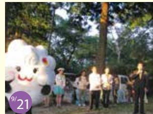
9/21 三次市 霧の海開き